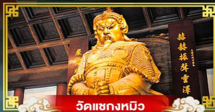
วัดחקงหมิว