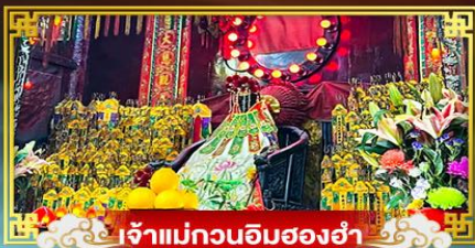
เจ้าแม่กวนอิมของฮ่า