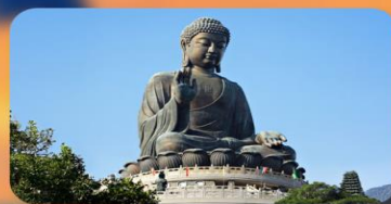
พระใหญ่นองปิง