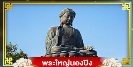
พระใหญ่นองปิง