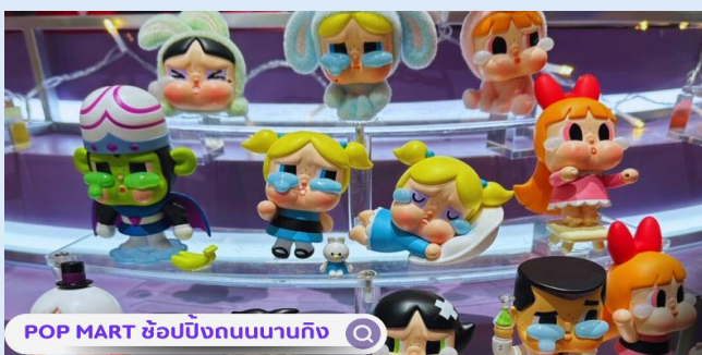
POP MART ช้อบบิงกนนานกิง

SKULLPANDA และอย่างอื่นอีกมากมาย ให้ท่านได้เลือกเล่นกันอย่างสนุกสนาน