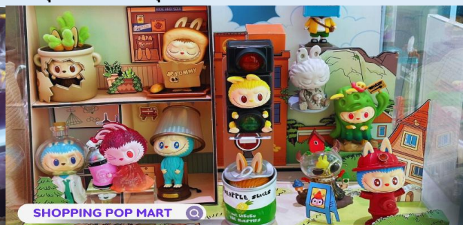
SHOPPING POP MART