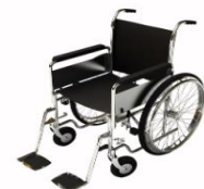
การบริการดูแลเป็นพิเศษ

กรณีผู้เดินทางต้องการความช่วยเหลือเป็นพิเศษ อาทิเช่น การใช้วีลแชร์ กรุณาแจ้งบริษัทฯ อย่างน้อย 7 วันก่อนการเดินทาง มิฉะนั้นบริษัทฯ จะไม่สามารถจัดการล่วงหน้าได้ เนื่องจากการขอใช้วีลแชร์ในสนามบินนั้น ต้องมีขั้นตอนในการขอล่วงหน้า และบางสายการบินอาจมีการเรียกเก็บค่าใช้จ่ายทั้งทางสนามบินในไทยและในต่างประเทศ ซึ่งผู้เดินทางสามารถสอบถามกับเจ้าหน้าที่ได้โดยตรงก่อนทำการจอง และหาก ในคณะของท่านมีผู้ต้องการดูแลพิเศษ เช่น ผู้ที่นั่งรถเข็น (Wheelchair), เด็ก, ผู้สูงอายุและผู้ที่มีโรคประจำตัวหรือไม่สะดวกในการเดินทางท่องเที่ยวในระยะเวลาเกินกว่า 4 - 5 ชั่วโมงติดต่อกัน ท่านและครอบครัวต้องให้การดูแลสมาชิกภายในครอบครัวของท่านเอง เนื่องจากการเดินทางเป็นหมู่คณะ หัวหน้าทัวร์มีความจำเป็นต้องดูแลคณะทัวร์ทั้งหมด