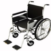
การรับบริการดูแลเป็นพิเศษ

กรณีผู้เดินทางต้องการความช่วยเหลือเป็นพิเศษ อาทิเช่น การใช้วีลแชร์ กรุณาแจ้งบริษัทฯ อย่างน้อย 7 วันก่อนการเดินทาง มิฉะนั้นบริษัทฯ จะไม่สามารถจัดการล่วงหน้าได้ เนื่องจากการขอใช้วีลแชร์ในสนามบินนั้น ต้องมีขั้นตอนในการขอล่วงหน้า และบางสายการบินอาจมีการเรียกเก็บค่าใช้จ่ายทั้งทางสนามบินในไทยและในต่างประเทศ ซึ่งผู้เดินทางสามารถสอบถามกับเจ้าหน้าที่ได้โดยตรงก่อนทำการจอง และหากในคณะของท่านมีผู้ต้องการดูแลพิเศษ เช่น ผู้ที่นั่งรถเข็น (Wheelchair), เด็ก, ผู้สูงอายุและผู้ที่มีโรคประจำตัวหรือไม่สะดวกในการเดินทางท่องเที่ยวในระยะเวลาเกินกว่า 4 - 5 ชั่วโมงติดต่อกัน ท่านและครอบครัวต้องให้การดูแลสมาชิกภายในครอบครัวของท่านเอง เนื่องจากการเดินทางเป็นหมู่คณะ หัวหน้าทัวร์มีความจำเป็นต้องดูแลคณะทัวร์ทั้งหมด