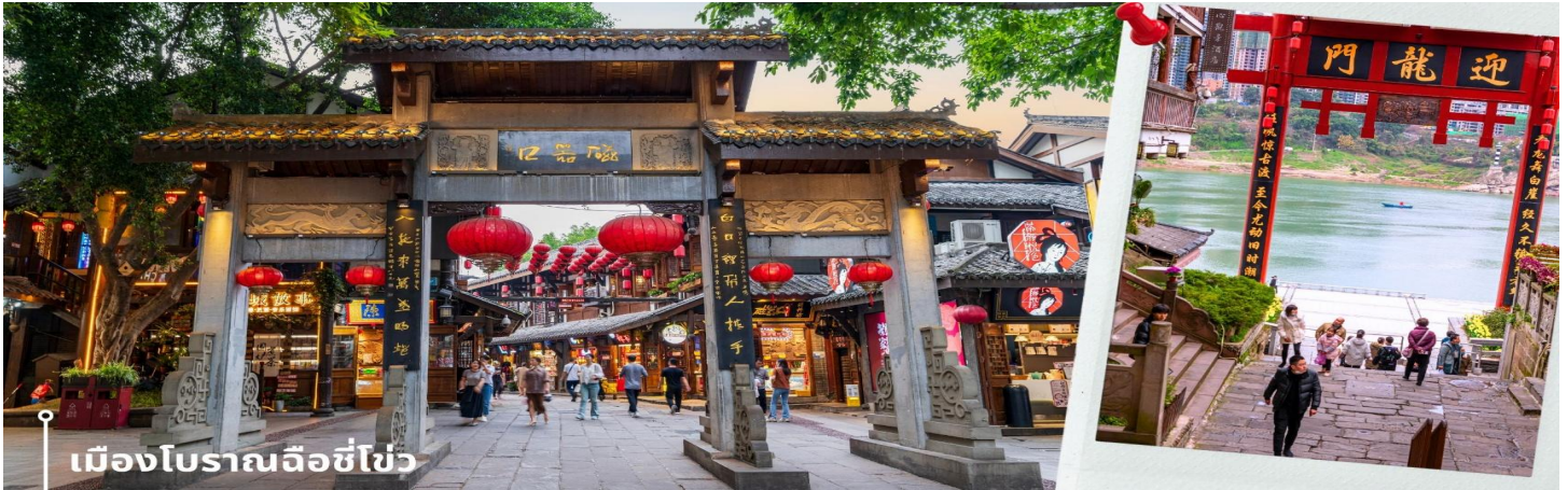
เมืองโบราณฉือชี่ไช่

เที่ยวฉงชิ่ง ที่เหมาะแก่การมาเดินเที่ยว ชิมอาหาร ถ่ายรูป และสัมผัสวิถีชีวิตแบบดั้งเดิมของชาวฉงชิ่งอย่างใกล้ชิดในบรรยากาศที่แสนสบาย