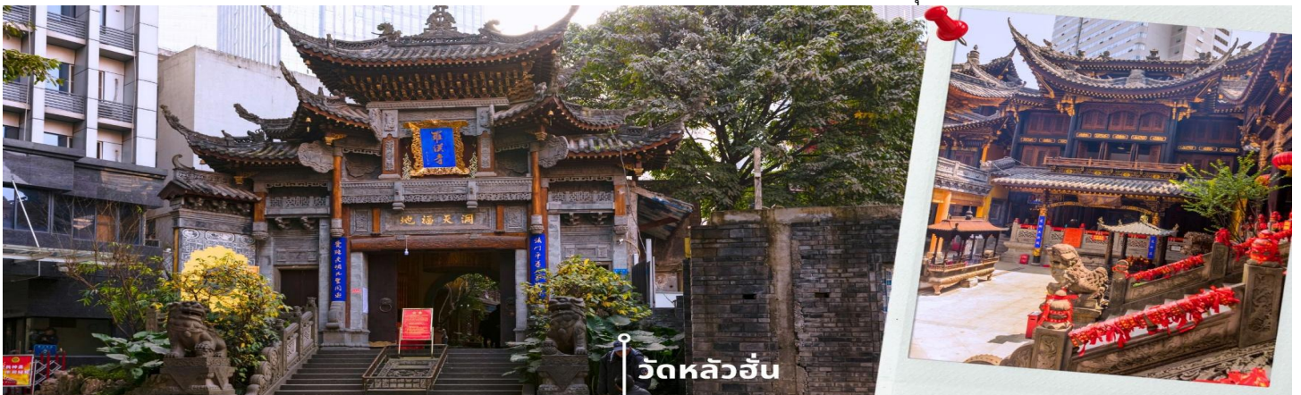
วัดหลัวฮั่น

นำท่านเดินทางสู่ วัดหลัวฮั่น (Luohan Temple) วัดสำนักงานใหญ่พุทธสมาคมแห่งนครฉงชิ่ง เป็นวัดเก่าแก่ที่สุดในฉงชิ่ง (Chongqing) ซึ่งสร้างขึ้นเมื่อ 1,000 ปีก่อน มีประวัติความเป็นมายาวนานเป็นจุดหมายทางศาสนาและเป็นศูนย์กลางของชาวพุทธในภูมิภาคการท่องเที่ยวที่สำคัญของภูมิภาค และเป็นแหล่งเรียนรู้ที่สำคัญของศิลปวัฒนธรรมจีน วัดนี้ประดิษฐานพระอรหันต์ถึง 500 องค์ แต่ละองค์มีลักษณะ ท่าทาง และสีหน้าแตกต่างกัน มีสถาปัตยกรรมแบบจีนโบราณที่สวยงามและละเอียดอ่อน พระอรหันต์ 500 องค์ แกะสลักด้วยหินและไม้ สะท้อนถึงความเชื่อในพุทธศาสนาและมีศิลปะจีน