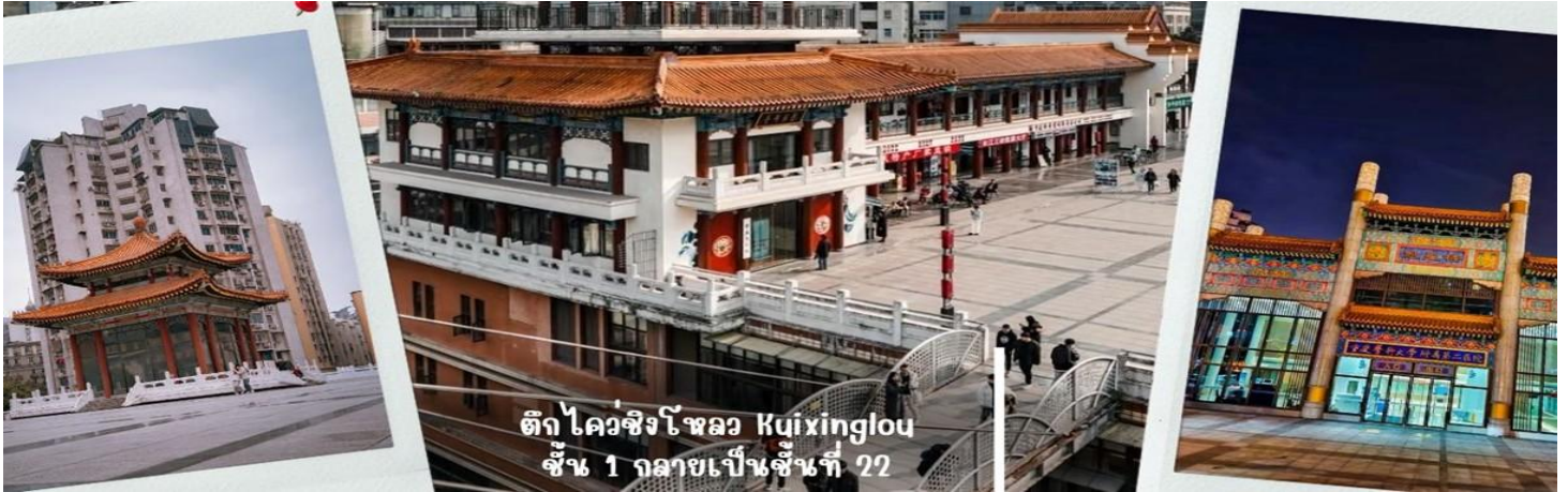
ตึกไคว่ชิงโหลว Kuixinglou ชั้น 1 กลายเป็นชั้นที่ 22

จากนั้น นำท่านเดินทางสู่ จัตุรัสเฉาเทียนเหมิน ซึ่งตั้งอยู่ ณ จุดบรรจบของ แม่น้ำแยงซี และ แม่น้ำเจียหลิง นับเป็นท่าเรือขนส่งทางน้ำที่ใหญ่ที่สุดของนครฉงชิ่ง และเป็นศูนย์กลางการค้าสำคัญมาอย่างยาวนาน บริเวณนี้ยังเป็นที่ตั้งของ ตลาดการค้าครบวงจรเฉาเทียนเหมิน ซึ่งถือเป็นตลาดขนาดใหญ่ที่สุดของฉงชิ่ง ทำให้พื้นที่โดยรอบเต็มไปด้วยผู้คนและมีชีวิตชีวาอยู่เสมอ ตั้งแต่อดีตจนถึงปัจจุบัน จัตุรัสแห่งนี้ได้รับการออกแบบให้มีลักษณะคล้ายเรือยักษ์ที่กำลังแล่นออกสู่สายน้ำอย่างสง่างาม จึงได้รับสมญานามว่า “ไททานิคแห่งฉงชิ่ง” เมื่อยืนอยู่บนจัตุรัส ท่านจะสามารถมองเห็นภาพอันน่าประทับใจของจุดบรรจบระหว่างแม่น้ำสองสาย โดยน้ำสีเหลืองของแม่น้ำแยงซีและน้ำสีเขียวมรกตของแม่น้ำเจียหลิงไหลมาบรรจบกันอย่างชัดเจน สร้างทัศนียภาพที่สวยงามและเป็นเอกลักษณ์ของฉงชิ่งอย่างแท้จริง