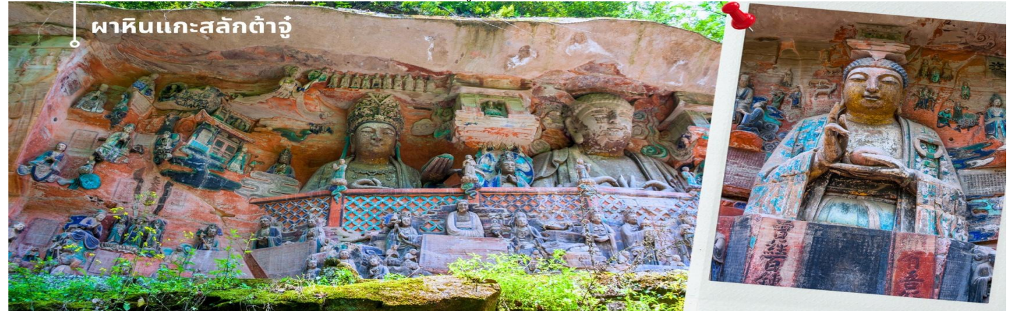
ผาหินแกะสลักต้าจู๋

เช้า รับประทานอาหารเช้า ณ ห้องอาหารของโรงแรมที่พัก (5) นำท่านเดินทางสู่ เมืองต้าจู๋ (ใช้เวลาเดินทางประมาณ 2 ชั่วโมง) จากนั้นนำท่านเดินทางสู่ ผาหินแกะสลักต้าจู๋ เขาเป่าตังซาน ผาหินแกะสลักที่ได้รับการบันทึกให้เป็นมรดกโลกทาง วัฒนธรรม ที่ผสมผสานบนความเชื่อด้านศาสนาและเป็นงานศิลปะที่ผสมผสาน จุดเด่นของเมืองต้าจู๋ที่แสดงถึงงานฝีมือใน การแกะสลักถ้ำและผาหิน กลุ่มผาหินแกะสลักต้าจู๋นั้นมีมากกว่า 70 จุด ขึ้นงานมากกว่า 1 แสนชิ้น ในนั้นถือว่า “เป่าตัง ซาน” และ “เป่ยซานม่อหย่า” สองสถานที่นี้มีหินแกะสลักชิ้นชื่อมากที่สุด เน้นไปทางพุทธศาสนาเป็นแบบอย่างของถ้ำหิน แกะสลักของประเทศจีนในยุคศิลปะตอนปลาย และ หินแกะสลักเป่าตังซาน เป็นตัวหลักในการขุดเจาะแกะสลักอย่าง ยากลำบากกว่า 70 กว่าปี หินแกะสลักที่นี้จะแกะตามรูปลักษณะของตัวภูเขา ด้วยความปราณีต และพิถีพิถัน มีความ สวยงามเพียงพร้อมด้วยเนื้อหามอกเล่าและเตือนสติผู้พบเห็น และยังมีการจัดแบ่งงานฝีมือของแต่ละยุคไว้ เป็นการประชัน ของช่างในแต่ละยุค ด้านใต้จะเป็นงานในยุคถึงตอนปลาย จนถึง ยุคห้ารัชกาล และ ด้านเหนือจะเป็นงานในสมัย ช่งเหนือซึ่ง ใต้ ซึ่งงานฝีมือในแต่ละยุคจะสะท้อนความเป็นอยู่และค่านิยมที่ไม่เหมือนกัน