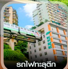
รถไฟฟ้าลูติก