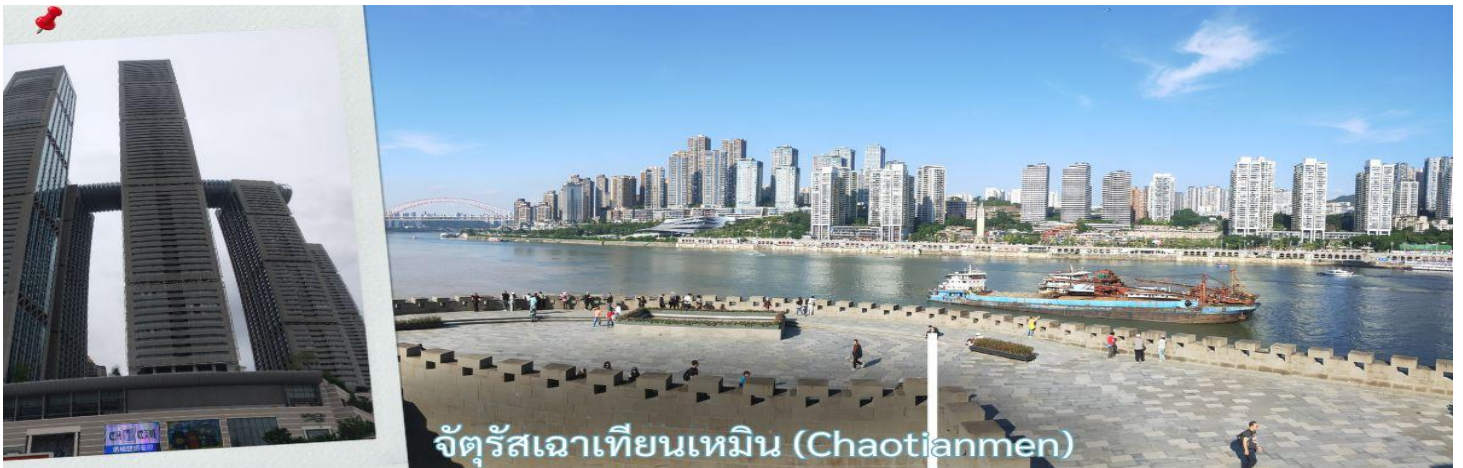
จัตุรัสเฉาเทียนเหมิน (Chaotianmen)

จากนั้น นำท่านเดินทางสู่ จัตุรัสเฉาเทียนเหมิน ซึ่งตั้งอยู่ ณ จุดบรรจบของ แม่น้ำแยงซี และ แม่น้ำเจียหลิง นับเป็นท่าเรือขนส่งทางน้ำที่ใหญ่ที่สุดของนครฉงชิ่ง และเป็นศูนย์กลางการค้าสำคัญมาอย่างยาวนาน บริเวณนี้ยังเป็นที่ตั้งของ ตลาดการค้าครบวงจรเฉาเทียนเหมิน ซึ่งถือเป็นตลาดขนาดใหญ่ที่สุดของฉงชิ่ง ทำให้พื้นที่โดยรอบเต็มไปด้วยผู้คนและมีชีวิตชีวาอยู่เสมอ ตั้งแต่อดีตจนถึงปัจจุบัน จัตุรัสแห่งนี้ได้รับการออกแบบให้มีลักษณะคล้ายเรือยักษ์ที่กำลังแล่นออกสู่สายน้ำอย่างสง่างาม จึงได้รับสมญานามว่า “ไททานิคแห่งฉงชิ่ง” เมื่อยืนอยู่บนจัตุรัส ท่านจะสามารถมองเห็นภาพอันน่าประทับใจของจุดบรรจบระหว่างแม่น้ำสองสาย โดยน้ำสีเหลืองของแม่น้ำแยงซีและน้ำสีเขียวมรกตของแม่น้ำเจียหลิงไหลมาบรรจบกันอย่างชัดเจน สร้างทัศนียภาพที่สวยงามและเป็นเอกลักษณ์ของฉงชิ่งอย่างแท้จริง