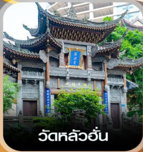
วัดหลิวอัน