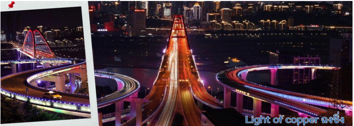
Light of copper ฉงชิ่ง

แนวถ่ายรูปวิวที่ Light of copper ฉงชิ่ง เป็นจุดชมวิวชื่อดังในมหานคร ฉงชิ่ง ประเทศจีน ซึ่งได้รับความนิยมอย่างมากในกลุ่มนักท่องเที่ยวและช่างภาพ จุดชมวิวทางยกระดับโดดเด่นด้วยทางเดินลอยฟ้าทรงกลมที่เชื่อมต่อกันสามารถมองเห็นวิวพาโนรามาของ สะพานซูเจียป่า (Sujiaba Interchange) ที่โค้งไปมาอย่างซับซ้อน และสะพานข้ามแม่น้ำแยงซีเกียง ไช่หยวนป่า (Caiyuanba Bridge) ท่ามกลางตึกสูงระฟ้าบรรยากาศยามค่ำคืน เมื่อเปิดไฟเมืองในช่วงค่ำจะเห็นแสงสีทองและสีทองแดงสะท้อนความงดงามของ "เมืองภูเขา" ได้อย่างชัดเจน