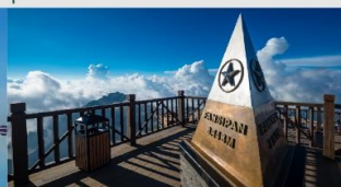
ฟานซิปัน

*ทางบริษัทฯ ขอสงวนสิทธิ์ในการสลับโปรแกรมทัวร์ตามความเหมาะสมขึ้นอยู่กับสถานการณ์หน้างาน โดยคำนึงถึงผลประโยชน์ของลูกค้าเป็นสำคัญ