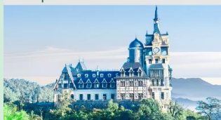
ปราสาทตามด้าว