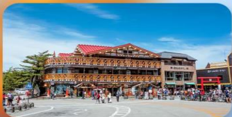
ภูเขาไฟฟูจิ ชั้นที่ 5