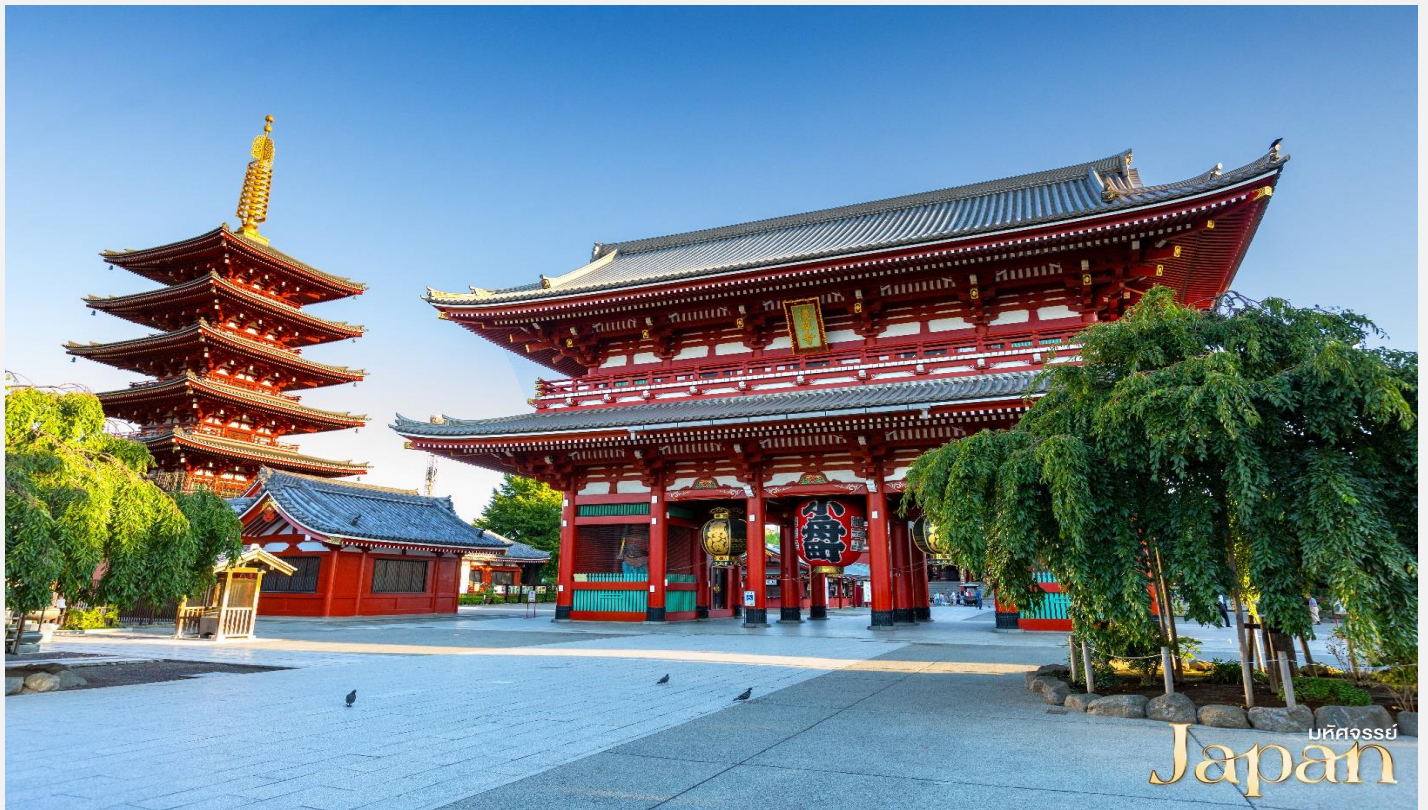
บันทึกจรรยา Japan

จากนั้น ชมวัดอาซากุสะ ที่มีประตูและโคมแดงยักษ์เป็นเอกลักษณ์อย่างโดดเด่นบริเวณด้านหน้าทางเข้าวัด ถูกสร้างขึ้นเสร็จเมื่อประมาณปี ค.ศ. 645 ตามตำนานเล่าว่าเมื่อประมาณปี 628 สองพี่น้องได้ออกเรือไปตกปลา และตกญี่ปุ่นเจ้าแม่กวนอิมได้ที่แม่น้ำสุมิเด และแม้ว่าพวกเขาจะพยายามทิ้งญี่ปุ่นกลับลงสู่แม่น้ำเท่าไรก็ตาม ญี่ปุ่นเจ้าแม่กวนอิมก็จะกลับมาหาพวกเขาอยู่เสมอ จึงได้มีการสร้างวัดนี้ขึ้นเพื่อเป็นที่ประดิษฐานของญี่ปุ่นเจ้าแม่กวนอิม และกลายมาเป็นวัดที่นิยมอันดับหนึ่งของเมืองโตเกียวในปัจจุบัน