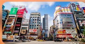
ซ้อปปิ้งชินจูกุ