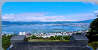
ทะเลสาบสุวะ

INTERNATIONAL RESORT HOTEL YURAKUJO NARITA หรือเทียบเท่ามาตรฐานญี่ปุ่น