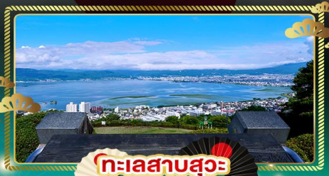
ทะเลสาบสุวะ