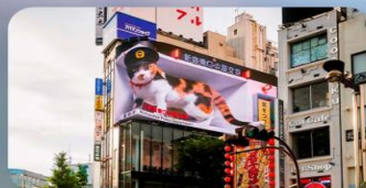
ช้อปปิ้งซินจูกุ