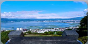
ทะเลสาบสุวะ