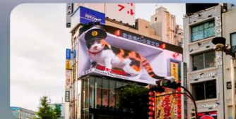
ช้อปปิ้งซินจูกุ