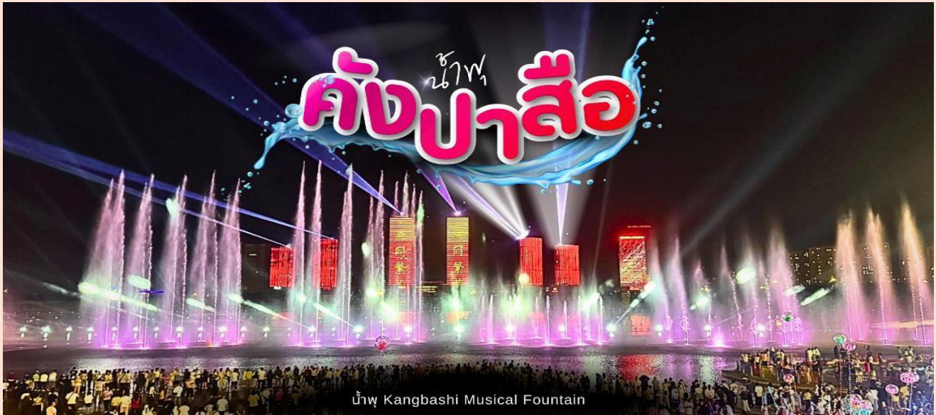
น้ำพุ Kangbashi Musical Fountain

DAY 6 เมืองออร์ดอส-วัดลามะ – ศูนย์วัฒนธรรมมองโกลหยวนหลิว - อนุสาวรีย์กองทัพเจงกิสข่าน - ถนนคนเดินคังปาสื่อ- สนามบินออร์ดอส – สนามบินสุวรรณภูมิ (กรุงเทพฯ) (เช้า/เที่ยง/-)