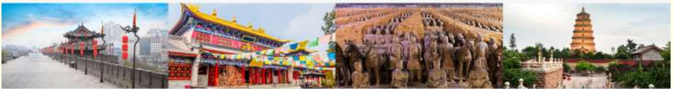
กำแพงเมืองโบราณ