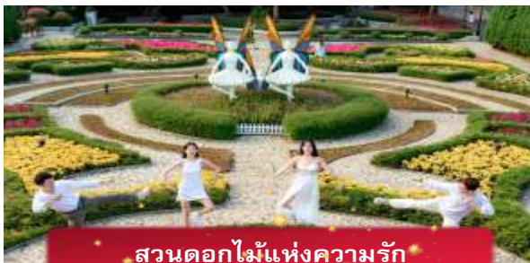
สวนดอกไม้แห่งความรัก