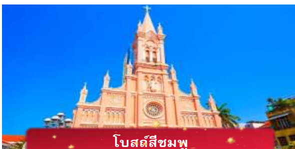
โบสถ์สีชมพู

ที่พัก MAGNOLIA HOTEL เทียบเท่าหรือระดับ 4 ดาวท้องถิ่น