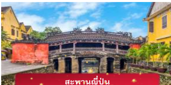
สะพานญี่ปุ่น