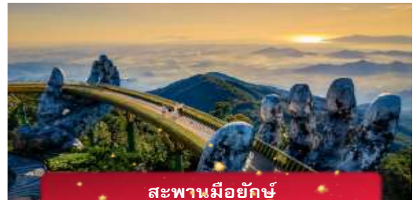
สะพานมียักษ์

นำท่านชม สะพานมียักษ์ แหล่งท่องเที่ยวใหม่ล่าสุดซึ่งอยู่บนเขาบานาฮิลล์ เป็นสะพานสีทองทอดยาวโดยมีมือ 2 ข้างอุ้มไว้ ตั้งอยู่ในตำแหน่งที่โดดเด่นเห็นชัด สวยงาม นำท่านชม สวนดอกไม้แห่งความรัก เป็นสวนดอกไม้สไตล์ฝรั่งเศส ที่มีดอกไม้หลากหลายพันธุ์ถูกจัดเป็นสัดส่วนอย่างสวยงามท่ามกลางอากาศที่แสนเย็นสบาย นำท่านชม สักการะพระพุทธรูปหลินอึ้ง เป็นพระพุทธรูปหินองค์ใหญ่ตั้งตระหง่านบนยอดเขาแห่งนี้ ให้ท่านได้ขอพรเพื่อความเป็นมงคล นำท่านชม ป๊อปมาร์ท เป็นร้านค้าของเล่นเปิดใหม่ล่าสุดที่อยู่บนยอดเขาบานาฮิลล์ มีสินค้าของเล่นสำหรับนักจุ่มมากมายให้ท่านได้เลือกชมกับตัวละครน่ารัก อาทิเช่น Molly, SkullPanda, Labubu หมายเหตุ: การจัดการ และข้อกำหนดในการเข้าชมสินค้าอยู่นอกเหนือการจัดการของบริษัททัวร์