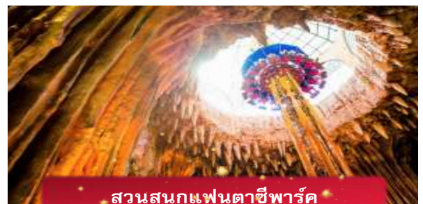
สวนสนุกแฟนตาซีพาร์ค

อิสระท่านท่องเที่ยว สวนสนุกแฟนตาซีพาร์ค ซึ่งมีเครื่องเล่นหลากหลายรูปแบบ เช่น ทำความผจญภัยของหนัง 4D ระทึกขวัญกับบ้านผีสิง เกมส์สนุกๆ เครื่องเล่นเบาๆ รถบั้ง หรือจะเลือกซื้อป๊อปปิ้งของที่ระลึกของสวนสนุก และ จัตุรัสแห่งดวงดาว เปรียบเสมือนการเดินทางสู่อาณาจักรแห่งดวงดาวที่มีเส้นทางเชื่อมต่อระหว่างอาณาจักรแห่งดวงจันทร์และอาณาจักรแห่งดวงอาทิตย์บนที่แสนงดงาม และสถาปัตยกรรมที่ล้ำสมัยจุดเด่นของที่แห่งนี้ก็คือกระจกใสทรงสามเหลี่ยมที่ดูคล้ายกับพิพิธภัณฑสถานลูฟวร์ที่ฝรั่งเศส ให้ความรู้สึกเหมือนท่านกำลังท่องอยู่ในโลกแห่งเวทมนต์และดวงดาว (ไม่รวมค่าเข้าชมหุ่นขี้ผึ้ง)