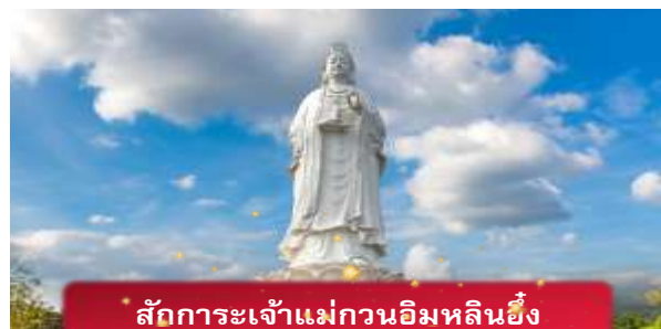
สักการะเจ้าแม่กวนอิมหลินอึ้ง