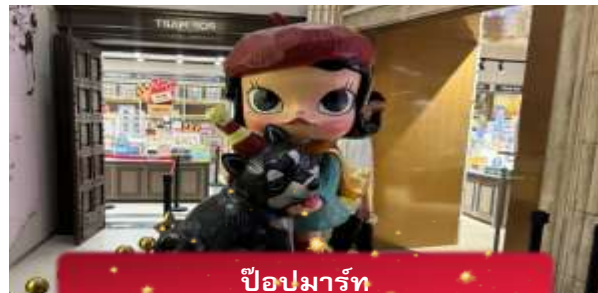
ป๊อปมาร์ท