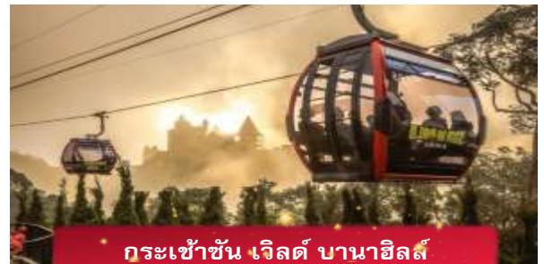
กระเช้าขึ้น เวิลด์ บานาฮิลล์

เที่ยง อีสรอาหารกลางวันเพื่อความสะดวกในการท่องเที่ยว