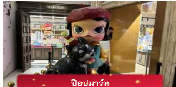
ป๊อปมาร์ท