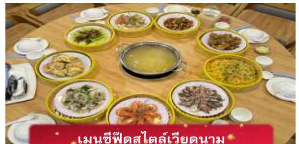
• เมนูซีฟู้ดสไตล์เวียดนาม •

17.05 เดินทางถึง สนามบินสุวรรณภูมิ โดยสวัสดิภาพ ... พร้อมความประทับใจ