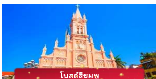
โบสถ์สีชมพู

ค่า บริการอาหารค่ำ ณ ภัตตาคาร พิเศษ ... เมนูบุฟเฟ่ปิ้งย่าง ที่พัก MAGNOLIA HOTEL เทียบเท่าหรือระดับ 4 ดาวท้องถิ่น