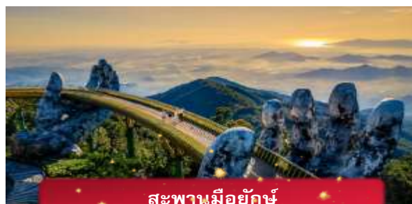
สะพานมอียักษ์

นำท่านชม สะพานมอียักษ์ แหล่งท่องเที่ยวใหม่ล่าสุดซึ่งอยู่บนเขาบานาฮิลล์ เป็นสะพานสีทองทอดยาวโดยมีมือ 2 ข้างอุ้มไว้ ตั้งอยู่ในตำแหน่งที่โดดเด่นเห็นชัด สวยงาม นำท่านชม สวนดอกไม้แห่งความรัก เป็นสวนดอกไม้สไตล์ฝรั่งเศส ที่มีดอกไม้หลากหลายพันธุ์ถูกจัดเป็นสัดส่วนอย่างสวยงามท่ามกลางอากาศที่แสนเย็นสบาย นำท่านชม สักการะพระพุทธรูปหลินอึ้ง เป็นพระพุทธรูปหินองค์ใหญ่ตั้งตระหง่านบนยอดเขาแห่งนี้ ให้ท่านได้ขอพรเพื่อความเป็นมงคล นำท่านชม ปิ๊อปมาร์ท เป็นร้านค้าของเล่นเปิดใหม่ล่าสุดที่อยู่นยอดเขาบานาฮิลล์ มีสินค้าของเล่นสำหรับนักจุ่มมากมายให้ท่านได้เลือกชมกับตัวละครน่ารัก อาทิเช่น Molly, SkullPanda, Labubu หมายเหตุ: การจัดการ และข้อกำหนดในการเข้าชมสินค้าอยู่นอกเหนือการจัดการของบริษัททัวร์