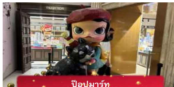
ปิ๊อปมาร์ท