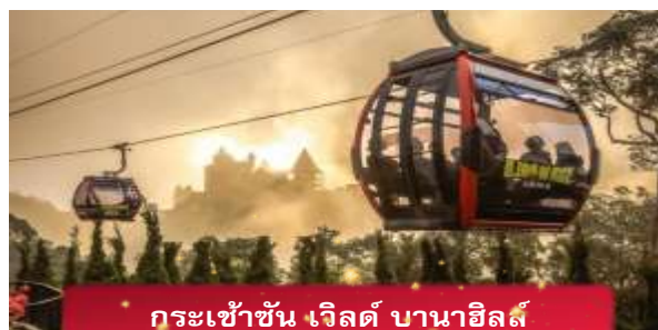
กระเช้าขึ้น เวิลด์ บานาฮิลล์

เที่ยง อีสรระอาหารกลางวันเพื่อความสะดวกในการท่องเที่ยว