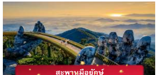
สะพานมียักษ์

นำท่านชม สะพานมียักษ์ แหล่งท่องเที่ยวใหม่ล่าสุดซึ่งอยู่บนเขาบานาฮิลล์ เป็นสะพานสีทองทอดยาวโดยมีมือ 2 ข้างอุ้มไว้ ตั้งอยู่ในตำแหน่งที่โดดเด่นเห็นชัด สวยงาม นำท่านชม สวนดอกไม้แห่งความรัก เป็นสวนดอกไม้สไตล์ฝรั่งเศส ที่มีดอกไม้หลากหลายพันธุ์ถูกจัดเป็นสัดส่วนอย่างสวยงามท่ามกลางอากาศที่แสนเย็นสบาย นำท่านชม สักการะพระพุทธรูปหลินอึ้ง เป็นพระพุทธรูปหินองค์ใหญ่ตั้งตระหง่านบนยอดเขาแห่งนี้ ให้ท่านได้ขอพรเพื่อความเป็นมงคล นำท่านชม ป๊อปมาร์ท เป็นร้านค้าของเล่นเปิดใหม่ล่าสุดที่อยู่บนยอดเขาบานาฮิลล์ มีสินค้าของเล่นสำหรับนักจุ่มมากมายให้ท่านได้เลือกชมกับตัวละครน่ารัก อาทิเช่น Molly, SkullPanda, Labubu หมายเหตุ: การจัดการ และข้อกำหนดในการเข้าชมสินค้าอยู่นอกเหนือการจัดการของบริษัททัวร์