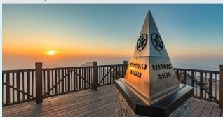
ฟานซิปัน