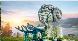
โมอาน่าคาเฟ่

*ทางบริษัทฯ ขอสงวนสิทธิ์ในการสลับโปรแกรมทัวร์ตามความเหมาะสมขึ้นอยู่กับสถานการณ์หน้างาน โดยคำนึงถึงผลประโยชน์ของลูกค้าเป็นสำคัญ