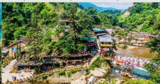
หมู่บ้านก๊ต ก๊ต