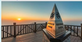
ฟานซิปัน