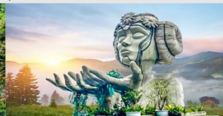
โมอาน่าคาเฟ่

*ทางบริษัทฯ ขอสงวนสิทธิ์ในการสลับโปรแกรมทัวร์ตามความเหมาะสมขึ้นอยู่กับสถานการณ์หน้างาน โดยคำนึงถึงผลประโยชน์ของลูกค้าเป็นสำคัญ