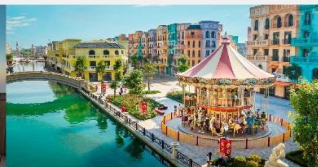
Mega Grand World