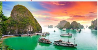
อ่าวฮาลอง

*ทางบริษัทฯ ขอสงวนสิทธิ์ในการสลับโปรแกรมทัวร์ตามความเหมาะสมขึ้นอยู่กับสถานการณ์หน้างาน โดยคำนึงถึงผลประโยชน์ของลูกค้าเป็นสำคัญ