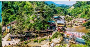
หมู่บ้านก๊ิต ก๊ิต