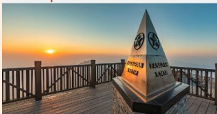
ฟานซิปัน