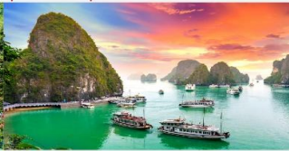
อ่าวฮาลอง

*ทางบริษัทฯ ขอสงวนสิทธิ์ในการสลับโปรแกรมทัวร์ตามความเหมาะสมขึ้นอยู่กับสถานการณ์หน้างาน โดยคำนึงถึงผลประโยชน์ของลูกค้าเป็นสำคัญ