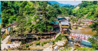
หมู่บ้านก๊ิต ก๊ิต