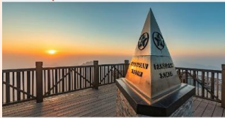
ฟานซิปัน