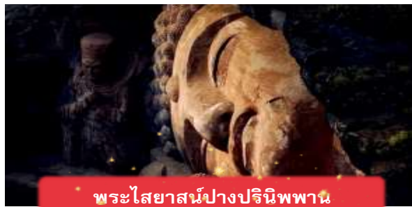
พระไสยาสน์ปางปรินิพพาน

ชำระเงินผ่าน บริษัท ลูกหมู ทราเวล จำกัด เท่านั้น!