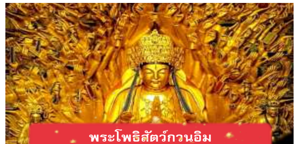
พระโพธิสัตว์กวนอิม

เช้า บริการอาหารเช้า ณ ห้องอาหารของโรงแรม นำท่านเดินทางสู่ มรดกโลกอุทยานผาหินแกะสลักต้าจู๋ ศิลปะหินแกะสลักอันล้ำค่าแห่งเมืองฉงชิ่งมรดกโลกที่องค์การยูเนสโกขึ้นทะเบียนเมื่อปี ค.ศ. 1999 ตั้งอยู่ทางตะวันตกของนครฉงชิ่ง ประเทศจีน ศิลปะหินแกะสลักเหล่านี้สร้างขึ้นตั้งแต่ราชวงศ์ถังจนถึงราชวงศ์ซ่ง มีอายุมากกว่า 1,000 ปีโดดเด่นด้วยงานแกะสลักทางพุทธศาสนาที่งดงามและยังคงสภาพสมบูรณ์ (ใช้เวลาเดินทางประมาณ 1-2 ชั่วโมง)