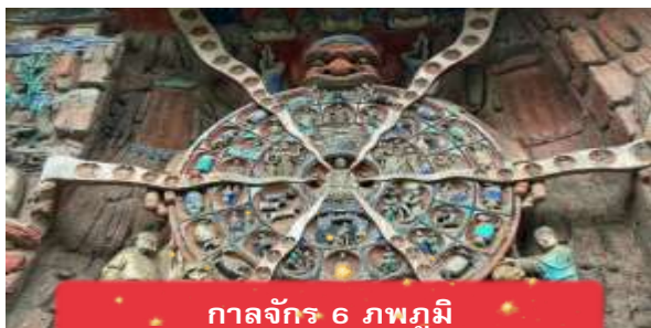
กาลจักร 6 ภพภูมิ