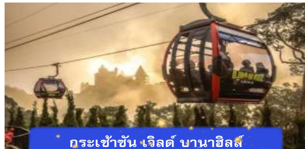
กระเช้าขึ้น เวิลด์ บานาฮิลล์