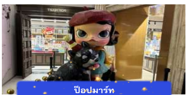
ป๊อปมาร์ท