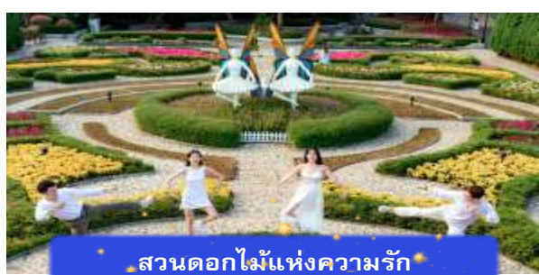
สวนดอกไม้แห่งความรัก

นำท่านชม สวนดอกไม้แห่งความรัก เป็นสวนดอกไม้สไตล์ฝรั่งเศส ที่มีดอกไม้หลากหลายพันธุ์ถูกจัดเป็นสัดส่วนอย่างสวยงามท่ามกลางอากาศที่แสนเย็นสบาย นำท่านชม สักการะพระพุทธรูปหินอึ้ง เป็นพระพุทธรูปหินองค์ใหญ่ตั้งตระหง่านบนยอดเขาแห่งนี้ให้ท่าน ได้ขอพรเพื่อความป็นมงคล นำท่านชม ป๊อปมาร์ท เป็นร้านค้าของเล่นเปิดใหม่ล่าสุดที่อยู่บนยอดเขานาฮิสล์ มีสินค้าของเล่นสำหรับนักจุ่มมากมายให้ท่านได้เลือกชมกับตัวละครน่ารัก อาทิเช่น Molly, SkullPanda, Labubu หมายเหตุ: การจัดการและข้อกำหนดในการเข้าชมสินค้าอยู่นอกเหนือการจัดการของบริษัททัวร์ อิสระท่านท่องเที่ยว สวนสนุกแพนดาศิฟาร์ค ซึ่งมีเครื่องเล่นหลากหลายรูปแบบ เช่น ท้าทายความมันส์ของหนัง 4D ระทึกขวัญกับบ้านผีสิง เกมส์สนุกๆ เครื่องเล่นเบาๆ รถบั๊ม หรือจะเลือกช้อปปิ้งของที่ระลึกของสวนสนุก และ จัตุรัสแห่งดวงดาว เปรียบเสมือนการเดินทางสู่อาณาจักรแห่งดวงดาวที่มีเส้นทางเชื่อมต่อระหว่างอาณาจักรแห่งดวงจันทร์และอาณาจักรแห่งดวงอาทิตย์ถนนที่แสนงดงาม และสถาปัตยกรรมที่ล้ำสมัยจุดเด่นของที่แห่งนี้ก็คือกระจกใสทรงสามเหลี่ยมที่ดูคล้ายกับพิพิธภัณฑลู่ฟวร์ที่ฝรั่งเศส ให้ความรู้สึกลเหมือนท่านกำลังท่องอยู่ในโลกแห่งเวทมนต์และดวงดาว (ไม่รวมค่าเข้าชมหุ่นขี้ผึ้งราคาประมาณ 1 แส่นดอง)