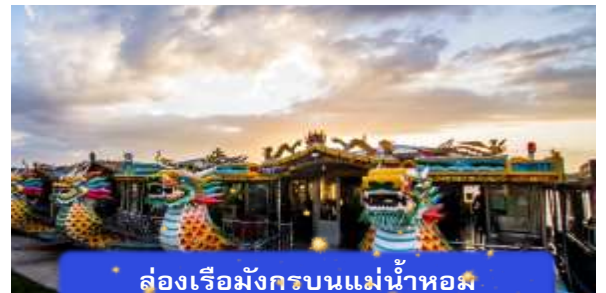
ล่องเรือมังกรบนแม่น้ำหอม

ที่พัก THANH BINH HOTEL ระดับ 4 ดาวมาตรฐานท้องถิ่น หรือเทียบเท่า