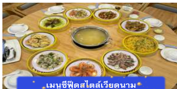
เมนูซีฟู้ดสไตล์เวียดนาม