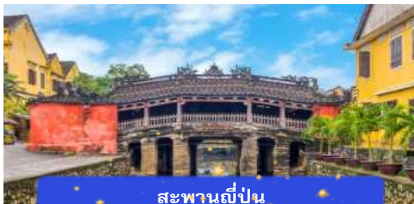
สะพานญี่ปุ่น

จากนั้นนำท่านเดินทางสู่ เมืองโบราณฮอยอัน เมืองมรดกโลกที่ยังคงเอกลักษณ์และรักษาวัฒนธรรมไว้อย่างดีเยี่ยม โดยท่านสามารถเดินเล่น ถ่ายรูป ตามตรอกซอกซอยต่างๆ ได้ ไฮไลท์ของการมาถ่ายรูปเช็คอินที่นี่คือการได้ขึ้นไปถ่ายรูปจากมุมสูงของคาเฟ่ที่อยู่ตามซอกซอย นำท่านชม สะพานญี่ปุ่น สะพานแห่งมิตรไมตรี ที่ได้ชื่อนี้เนื่องจากสะพานแห่งนี้สร้างขึ้นโดยชุมชนชาวญี่ปุ่น เป็นสะพานที่สร้างขึ้นข้ามคลองที่ในอดีต 400 ปีกว่าที่ผ่านมา