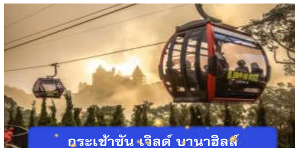
กระเช้าขึ้น เวิลด์ บานาฮิลล์