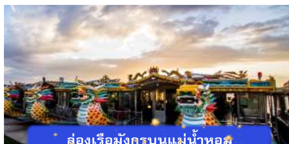
ล่องเรือมังกรบนแม่น้ำหอม

ที่พัก THANH BINH HOTEL ระดับ 4 ดาวมาตรฐานท้องถิ่น หรือเทียบเท่า