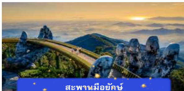
สะพานมียักษ์

เที่ยง อีสรอาหารกลางวันเพื่อความสะดวกในการท่องเที่ยว