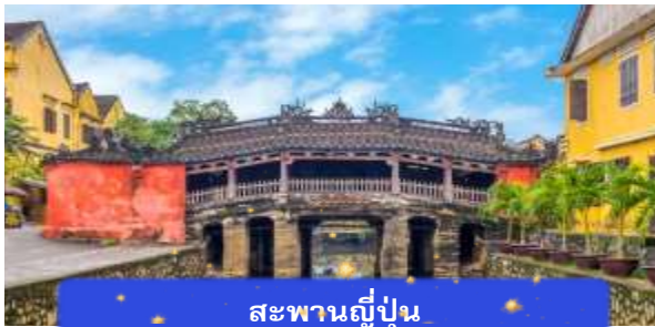
สะพานญี่ปุ่น

เช้า บริการอาหารเช้า ณ ห้องอาหารของโรงแรม จากนั้นนำท่านเดินทางสู่ เมืองโบราณฮอยอัน เมืองมรดกโลกที่ยังคงเอกลักษณ์และรักษาวัฒนธรรมไว้อย่างดีเยี่ยม โดยท่านสามารถเดินเล่น ถ่ายรูป ตามตรอกซอกซอยต่างๆ ได้ ไฮไลท์ของการมาถ่ายรูปเช็คอินที่นี่คือการได้ขึ้นไปถ่ายรูปจากมุมสูงของคาเฟ่ที่อยู่ตามซอกซอย นำท่านชม สะพานญี่ปุ่น สะพานแห่งมิตรไมตรี ที่ได้ชื่อนี้เนื่องจากสะพานแห่งนี้สร้างขึ้นโดยชุมชนชาวญี่ปุ่น เป็นสะพานที่สร้างขึ้นข้ามคลองที่ในอดีต 400 ปีกว่าที่ผ่านมา