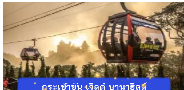
กระเช้าขึ้น เวิลด์ บานาฮิลล์