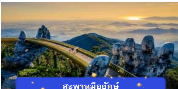
สะพานมียักษ์

เที่ยง อีศระอาหารกลางวันเพื่อความสะดวกในการท่องเที่ยว