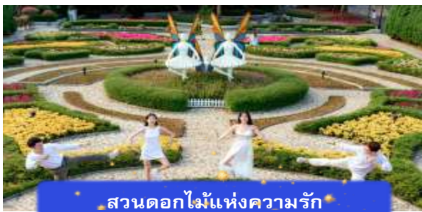
สวนดอกไม้แห่งความรัก

นำท่านชม สวนดอกไม้แห่งความรัก เป็นสวนดอกไม้สไตล์ฝรั่งเศส ที่มีดอกไม้หลากหลายพันธุ์ถูกจัดเป็นสัดส่วนอย่างสวยงามท่ามกลางอากาศที่แสนเย็นสบาย นำท่านชม สักการะพระพุทธรูปหินอึ้ง เป็นพระพุทธรูปหินองค์ใหญ่ตั้งตระหง่านบนยอดเขาแห่งนี้ให้ท่านได้ขอพรเพื่อความป็นมงคล นำท่านชม ป๊อปมาร์ท เป็นร้านค้าของเล่นเปิดใหม่ล่าสุดที่อยู่บนยอดเขานาฮิลล์ มีสินค้าของเล่นสำหรับนักจุ่มมากมายให้ท่านได้เลือกชมกับตัวละครน่ารัก อาทิเช่น Molly, SkullPanda, Labubu หมายเหตุ: การจัดการและข้อกำหนดในการเข้าชมสินค้าอยู่นอกเหนือการจัดการของบริษัททัวร์ อิสระท่านท่องเที่ยว สวนสนุกแพนดาศีฟาร์ค ซึ่งมีเครื่องเล่นหลากหลายรูปแบบ เช่น ทำทายความมันส์ของหนัง 4D ระทึกขวัญกับบ้านผีสิง เกมส์สนุกๆ เครื่องเล่นเบาๆ รถบั้ง หรือจะเลือกซื้อป๊ิงของที่ระลึกของสวนสนุก และ จัตุรัสแห่งดวงดาว เปรียบเสมือนการเดินทางสู่อาณาจักรแห่งดวงดาวที่มีเส้นทางเชื่อมต่อระหว่างอาณาจักรแห่งดวงจันทร์และอาณาจักรแห่งดวงอาทิตย์อันที่แสนงดงาม และสถาปัตยกรรมที่ล้ำสมัยจุดเด่นของที่แห่งนี้ก็คือจุดคือกระจกใสทรงสามเหลี่ยมที่ดูคล้ายกับพิพิธภัณฑลู่ฟวร์ที่ฝรั่งเศส ให้ความรู้สึกลเหมือนท่านกำลังท่องอยู่ในโลกแห่งเวทมนต์และดวงดาว (ไม่รวมค่าเข้าชมหุ่นขี้ผึ้งราคาประมาณ 1 แส่นดอง)