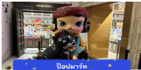
ป๊อปมาร์ท