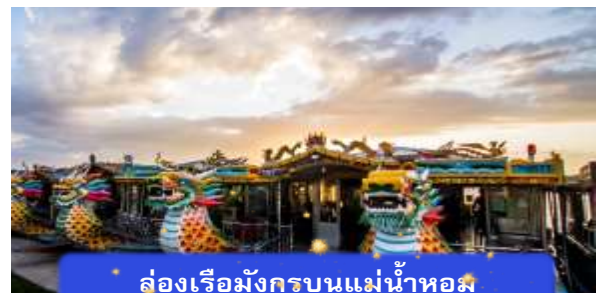
ล่องเรือมังกรบนแม่น้ำหอม

ที่พัก THANH BINH HOTEL ระดับ 4 ดาวมาตรฐานท้องถิ่น หรือเทียบเท่า