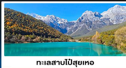
ทะเลสาบไป๋สยู่เหอ