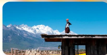
กาแฟ Yun Yi Tang