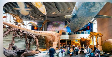
พิพิธภัณฑ์เซี่ยงไฮ้