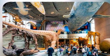
พิพิธภัณฑ์เซี่ยงไฮ้