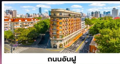
ถนนอันฟู