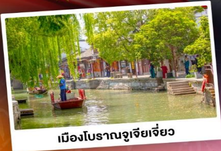
เมืองโบราณซูโจวเจียว