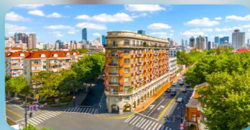
ถนนอันฟู