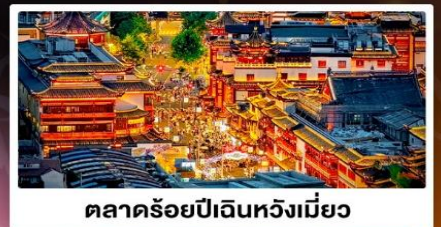
ตลาดร้อยปีเงินหวงเมี่ยว