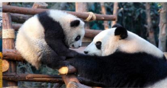
หุบเขาแพนด้าตูเจียงเอี้ยน