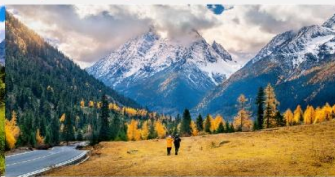
ภูเขาสี่ดรุณี (หุบเขาชวงเจียวโกว)