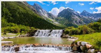
อุทยานแห่งชาติปี้เฟิงโกว