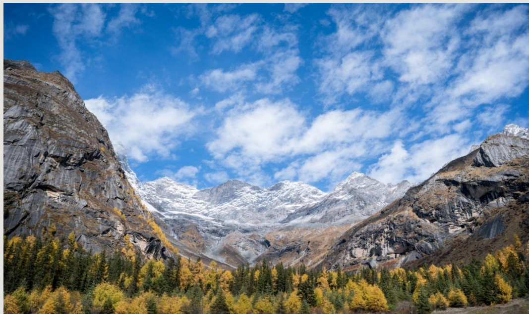
ฤดูใบไม้ร่วง (AUTUMN)