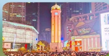
ถนนคนเดินเจียวฟางเป่ย์