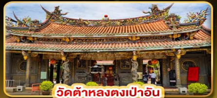
วัดต้าหลงตงเป่าอัน