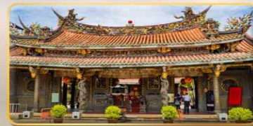
วัดต้าหลงตงเป่าอัน