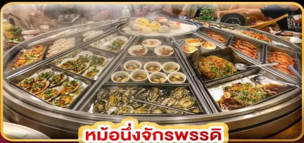
หม้อหนึ่งจักรพรรดิ

แพคเกจรวมตั๋วเครื่องบิน บินคุ้ม เที่ยวครบ เช็किनทุกจุดไฮไลท์