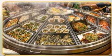
หม้อหนึ่งจักรพรรดิ