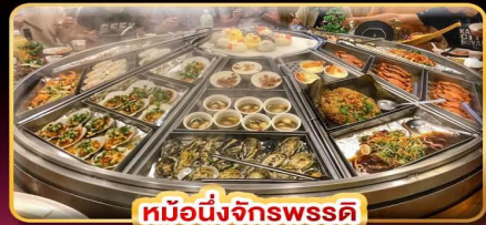
หม้อนึ่งจักรพรรดิ

กล่องโดมคองแท้งทางรถไฟผิงซี บินคุ้ม เที่ยวครบ เช็किनทุกจุดไฮไลท์