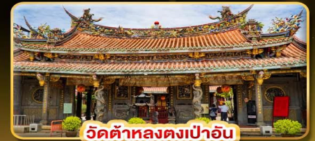
วัดต้าหลงตงเป่าอัน