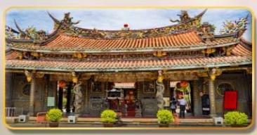
วัดต้าหลงตงเป่าอัน