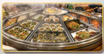
หม้อหนึ่งจักรพรรดิ