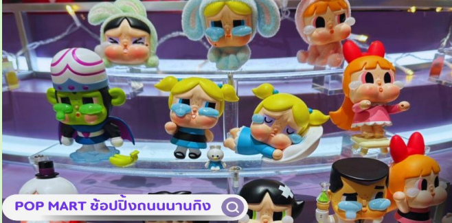
POP MART ช้อปปังกนนานกิง

ชายของกันศึกตั้งตั้งแต่ทศวรรษ 1920 ตั้งอยู่ฝั่งผู้ซิงกินพื้นที่ยาวตั้งแต่ฝั่งตะวันตกของ “เดอะ บันด์” ถึง “พีเพิลส์ สแควร์” เป็นแหล่งช้อปปิ้งสินค้าแบรนด์เนมจากทั่วโลก และยังเป็นศูนย์รวมร้านค้าและร้านอาหารอีกมากมาย และพลาดไม่ได้กับนักจุ่มอาร์ททอยอย่าง แบรินด์ POP MART GLOBAL FLAGSHIP STORE ร้านขายของเล่นที่เป็นที่โด่งดังในขณะนี้ไม่ว่าจะ LABUBU MOLLY SKULLPANDA และอย่างอื่นอีกมากมาย ให้ท่านได้เลือกเล่นกันอย่างสนุกสนาน