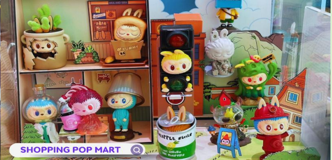
SHOPPING POP MART

ค่า รับประทานอาหารค่า ณ ภัตตาคาร (มือที่ 2)