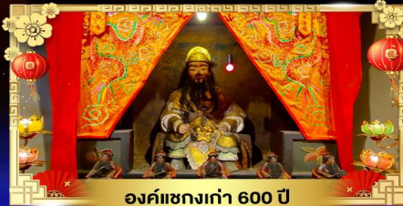
องค์แซกงเก่า 600 ปี