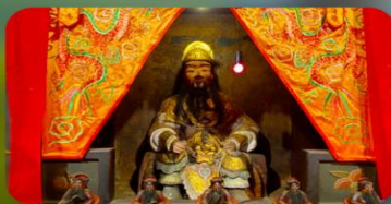
องค์แขงเก่า 600 ปี