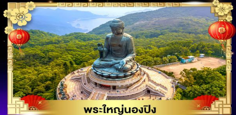
พระใหญ่หนองปีง