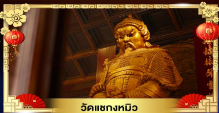
วัดแขกหมิว

หมูนกทั้งหันนำโชควัดแขก สวนสนุกดิสนีย์แลนด์เต็มวัน