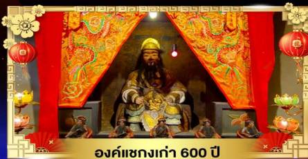
องค์แขกเก่า 600 ปี