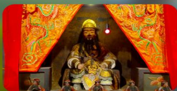
องค์เขกเก่า 600 ปี