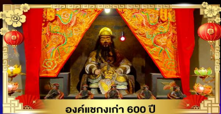
องค์แขงเก่า 600 ปี