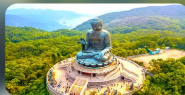
พระใหญ่นองปิง