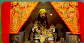
องค์แขกเก่า 600 ปี