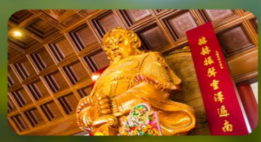
วัดแขกหมิว