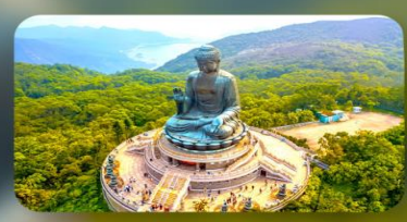
พระใหญ่นองปิง