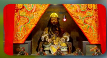
องค์แขกเก่า 600 ปี