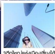
3 ตึกใหญ่แห่งเมืองเซี่ยงไฮ้