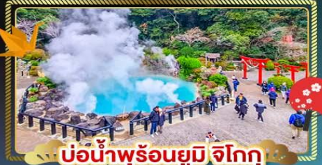
บ่อน้ำพุร้อนยูมิจิโกกุ