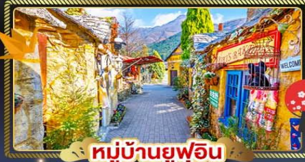
หมู่บ้านยุฟุอิน