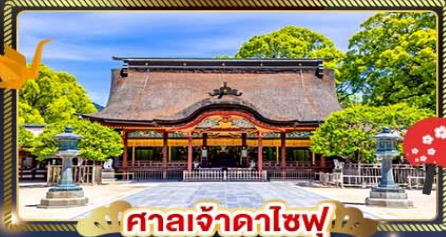
ศาลเจ้าดาโซฟุ