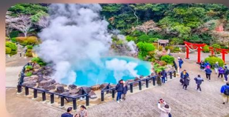
บ่อน้ำพุร้อนยูมิ จิโกกุ