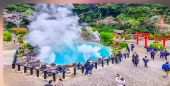
บ่อน้ำพุร้อนยูมิ จิโกกุ