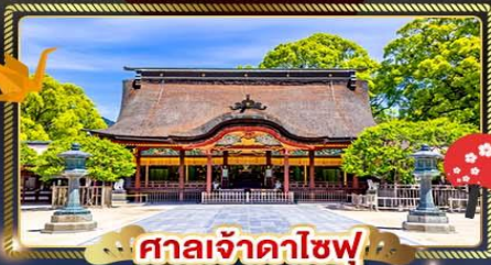
ศาลเจ้าดาโซฟุ