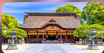
ศาลเจ้าคาโซฟู