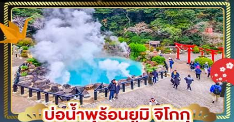
บ่อน้ำพุร้อนยูมิจิโกกุ