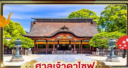
ศาลเจ้าดาโชฟู