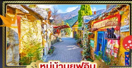
หมู่บ้านยุฟุอิน