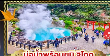
บ่อน้ำพุร้อนยูมิจิโกกุ