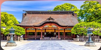
ศาลเจ้าคาโซฟู