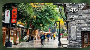
ถนนชวยกวางชวยแคบ