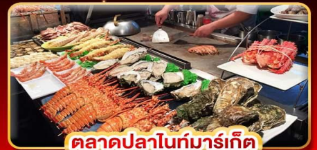
ตลาดปลาไนท์มาร์เก็ต