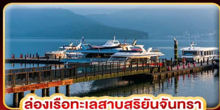
ล่องเรือทะเลสาบสุริยจันทร

บินคุ้ม STREET FOOD แบบจุใจ ขอความรักมัดแปลงชาน