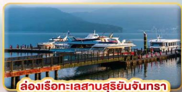
ล่องเรือชมทะเลสาบสุริยันจันทรา