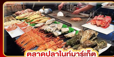
ตลาดปลาไถ่มาร์เก็ท