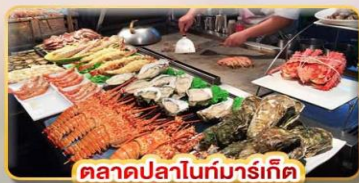
ตลาดปลาไนท์มาร์เก็ต