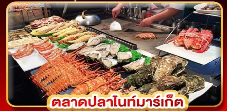
ตลาดปลาไนท์มาร์เก็ต