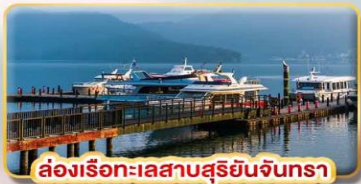
ล่องเรือชมทะเลสาบสุริยันจันทรา