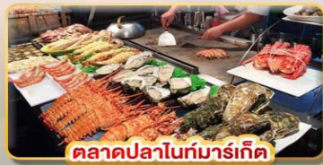
ตลาดปลาไนท์มาร์เก็ต