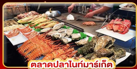
ตลาดปลาไนท์มาร์เก็ต