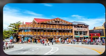
ฟูจิชั้น 5